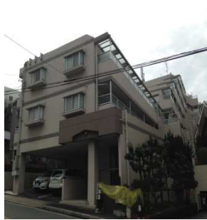
アークヒルズ虹ヶ丘 (賃貸ファミリーマンション 23 室)