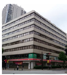
フジモト第一生命ビル (賃貸オフィスビル 35 区画)