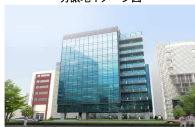
オフィスビルイメージ図