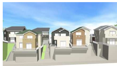
分譲地イメージ図

賃貸データ、ランニングコスト等を算出し、不動産から生じるキャッシュ・フローの分析を基に、用地周辺のマーケット動向を調査し、周辺の特성에応じたコンセプト（物件のデザイン性、利用者の機能性など）など企画し販売を行っております。