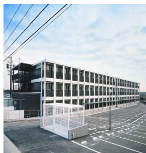
アイルームいなべ大安 (賃貸ワンルームマンション 78 室)