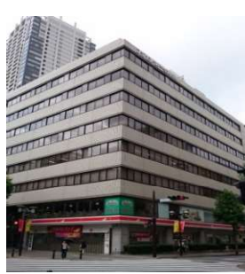
フジモト第一生命ビル (賃貸オフィスビル35区画)