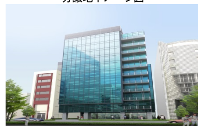
オフィスビルイメージ図

当社の不動産仲介・コンサルティング事業では、本社（愛知県）及び、事業所（東京都）がある2拠点を中心に居住用賃貸マンション・オフィスビル・商業店舗などの賃貸仲介業務を行っております。「地域密着」を掲げ、地元の不動産業者や、家主（オーナー）から物件情報を収集・蓄積し、お客様（ユーザー）に紹介しております。当社では、不動産仲介・コンサルティング事業において恒常的にユーザーニーズと向き合うことで、結果的に不動産投資開発事業におけるマーケティングノウハウや、企画立案におけるコンセプトにフィードバックしております。