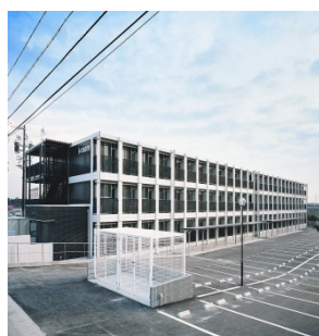
アイルームいなべ大安 (賃貸ワンルームマンション78室)