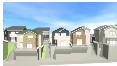
分譲地イメージ図

賃貸データ、ランニングコスト等を算出し、不動産から生じるキャッシュ・フローの分析を基に、用地周辺のマーケット動向を調査し、周辺の特性に応じたコンセプト（物件のデザイン性、利用者の機能性など）など企画し販売を行っております。