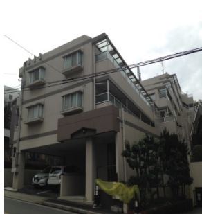
アークヒルズ虹ヶ丘 (賃貸ファミリーマンション23室)